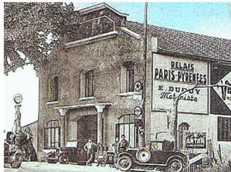
Le garage Dupuis de Sainte-Maure, « Relais Paris-Pyrénées » : le bâtiment a été protégé en 2013, dans le cadre du Plan local d'urbanisme de la commune.